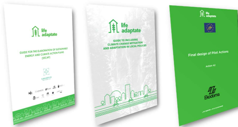
Materiales del proyecto LIFE Adaptate objeto de difusión