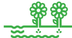
Alfândega da Fé

Creación de zonas de sombra con integración de energías renovables